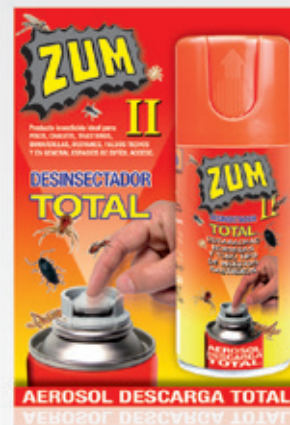
AEROSOL DESCARGA TOTAL